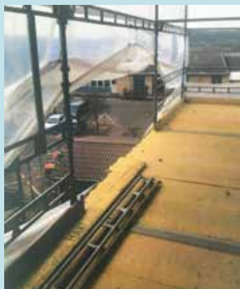
Manglende opsætning af rækværk efter demontering