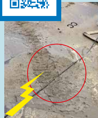
Ubeskyttede/ødelagte kabler på jernpladeveje og andre køreveje