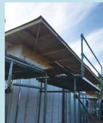
Bukkestilladser, der er samlet efter forhåndenværende-søms-princip