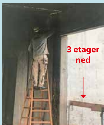
Risikoadfærd ved arbejde fra stige