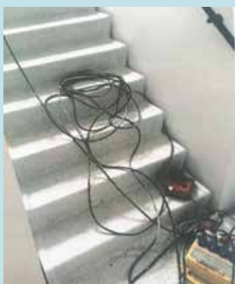
Kabler i gangveje