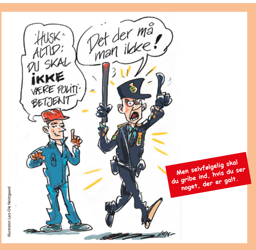
Illustrator: Lars-Ole Neistgaard