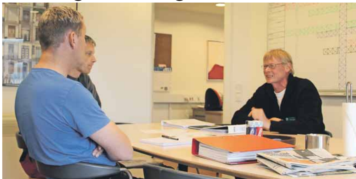
Byggeriets Arbejdsmiljøbus vejleder i årlig arbejdsmiljødrøftelse

En gang om året skal alle virksomheder ifølge loven afholde en arbejdsmiljødrøftelse. Det er arbejdsgiveren, der skal indkalde til drøftelsen og sikre, at der følges op på de beslutninger, der træffes.