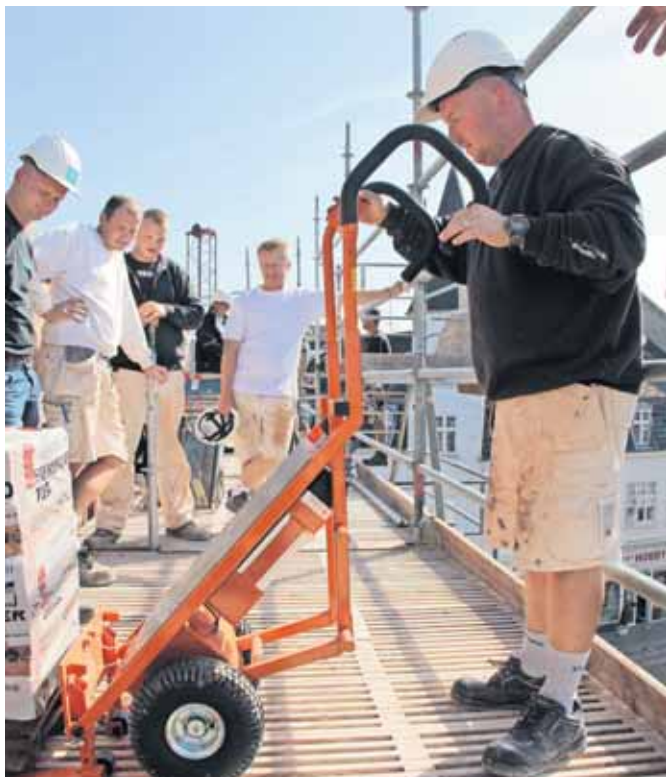
Styr på arbejdsmiljøorganisationen giver også bedre styr på arbejdsmiljøet.