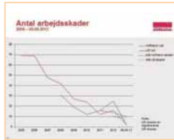
Kurven er knækket.

har der været øget fokus på sikkerheden. Målet er et skadesfrit arbejdsmiljø for alle på byggepladserne, og Hoffmann er godt på vej. Men det handler om at ændre en kultur, og det er et langt sejt træk. Kulturen bæres af alle på arbejdspladsen, og derfor har alle, også