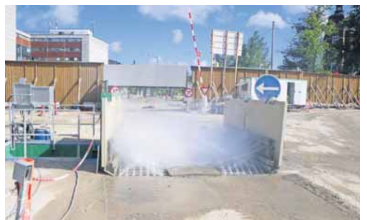
Den automatiske undervognsskyller, Moby Dick, fra Hautek, sørger for rene veje omkring byggepladsen.