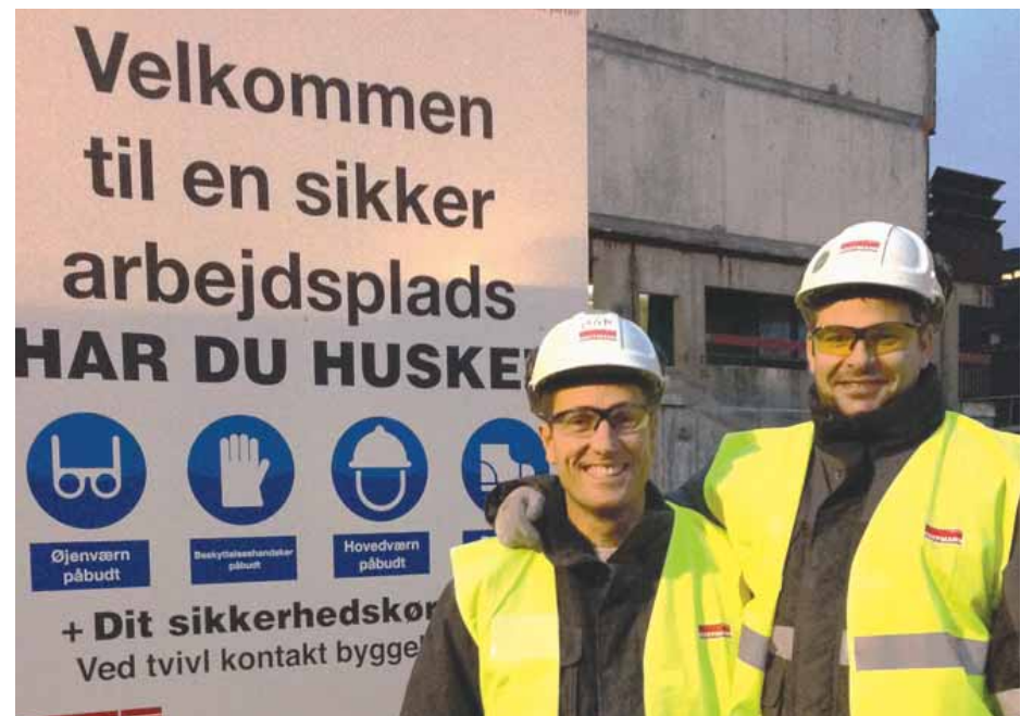
To veludrustede gutter fra Hoffmann A/S.

Man kan jo ikke klage over, at nogen vil passe på os. Jeg er dog lidt spændt på, hvordan det bliver at skulle bære beskyttelsesbriller hele tiden, men så længe vi får nogle, som er af god kvalitet, så bliver det nok hurtigt bare en vane.