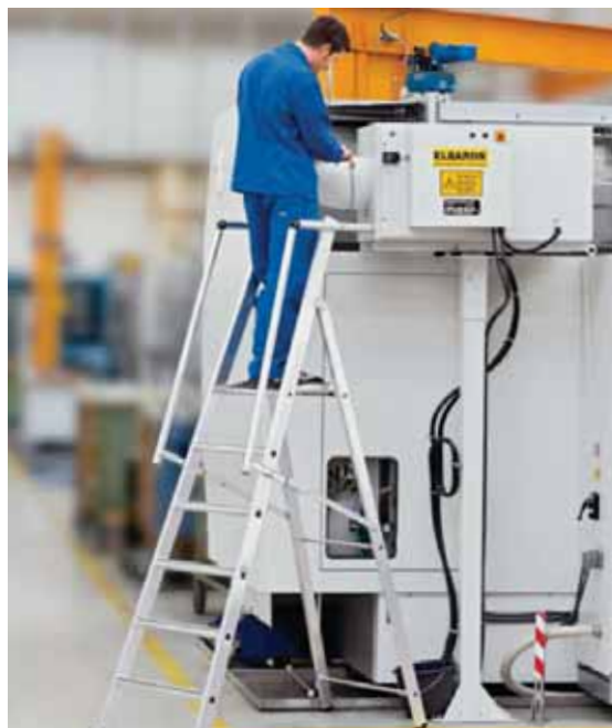
Nu kan du nå det sidste lille hjørne – uden at sætte livet på spil.