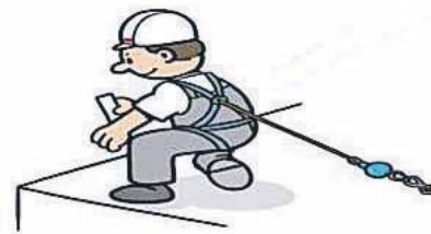
Fastgørelsespunkter - Hvor og hvordan?

Det er ganske vist: Brug af faldsikring er ikke ufarligt. Er du klar over, at skulle uheldet være ude, og du falder ud over kanten, så skal du være ualmindelig heldig, hvis du ikke får voldsomme skader af faldet? Og at der i øvrigt er stor sandsynlighed for, at du dør af at hænge i selve selen og vente på redningen?