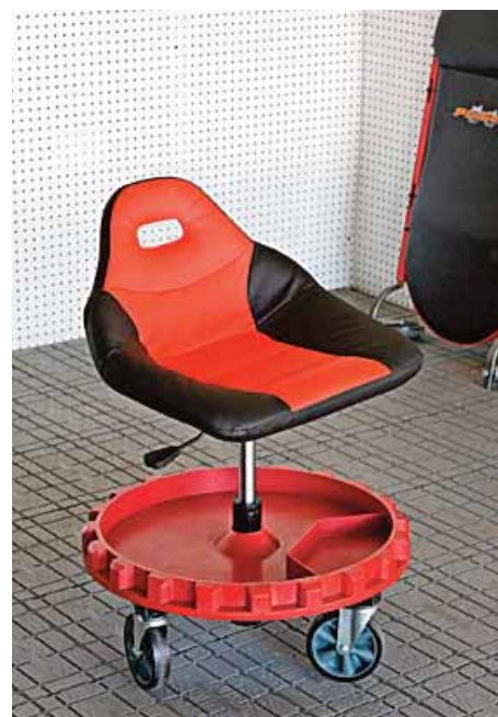
Et racersæde kan være med til at løse problemerne ved det knæliggende arbejde.

Flisemontørerne i virksomheden ModulBad, der er et brand under CRH Concrete A/S, har en del knæliggende arbejde ved montage af fliser i badekabiner. Derfor har ModulBad fået et