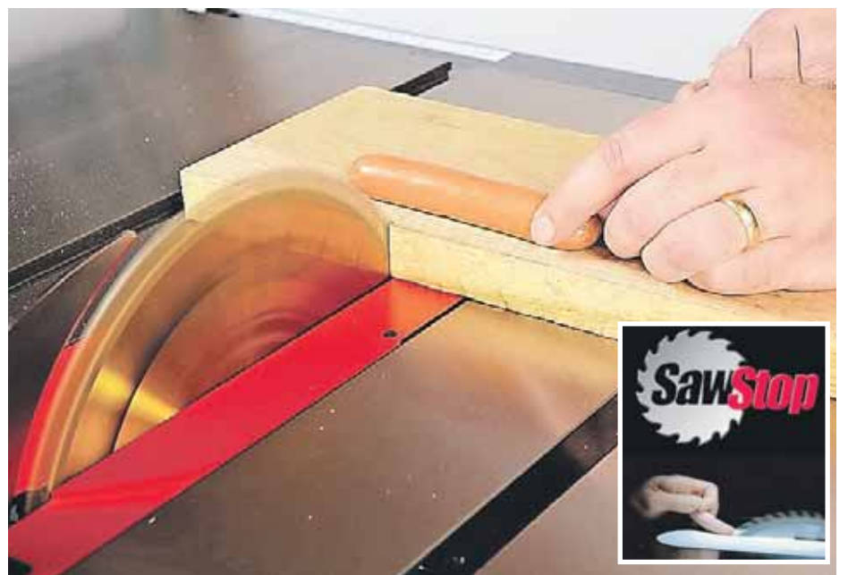
Sådan får du pølserne i maskinen.

En ny rundsav nægter at skære i hverken pølser eller menneskefingre. Man tror, det er løgn, men se filmen og se det ske.