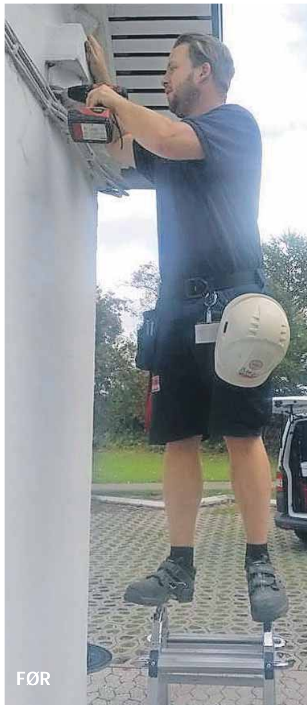
Jeg tænkte ikke over, hvor meget der kunne gå galt.