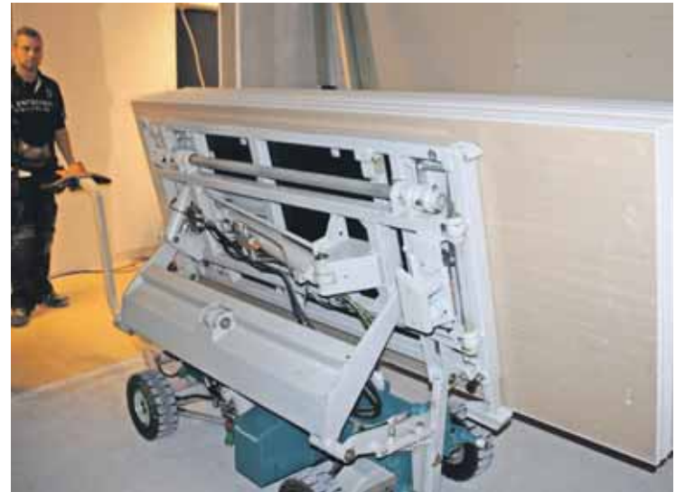
“Det bliver hverdag – ligesom at køre i bil,” siger holdet om brugen af Mountit-systemet.