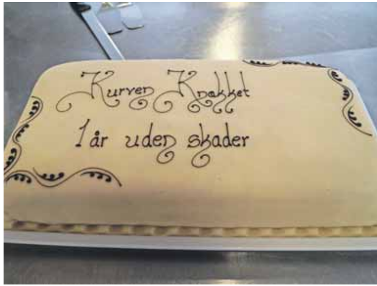
Når der er noget at fejre, skal der kage på bordet.

Hos Hoffmann har man knækket kurven, når det gælder skader og sygefravær.