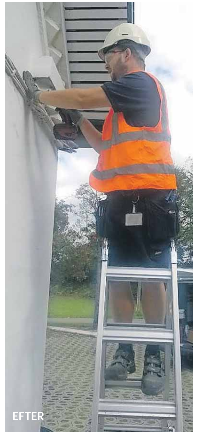
Brug af bl.a. værnemidler er nu en naturlig del af hverdagen