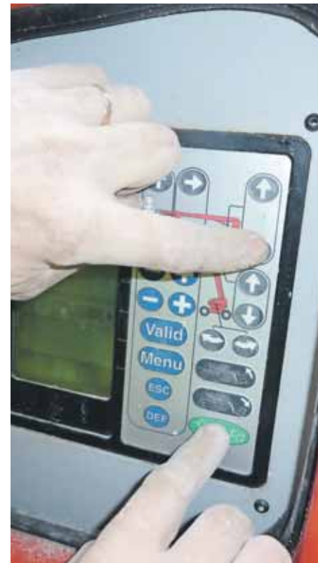
Det er svært at finde ud af, hvordan liften nødsænkes, når der ikke er nogen form for anvisninger ved panelet.

■ Sørg for at komme på et kursus i betjening af personlifte. Du finder nemt et på www.ug.dk