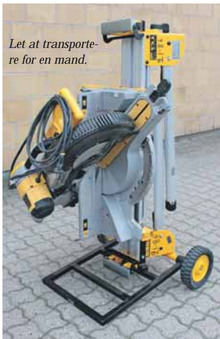
Let at transportere for en mand.

“Vi har desværre ikke kunnet få Dewalt til at købe ideen, så har vi selv